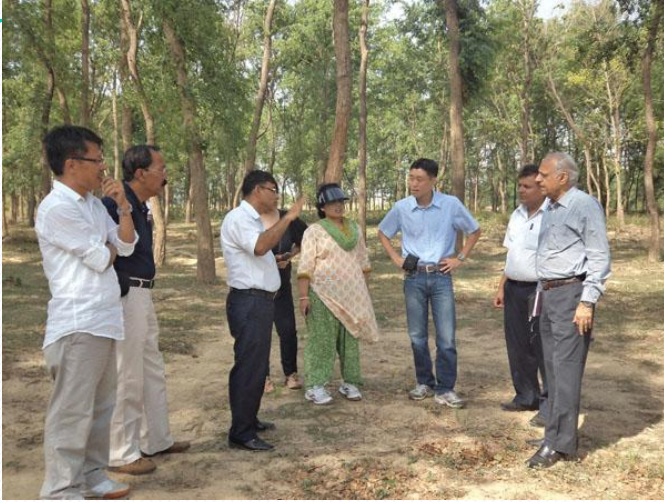
सेनेटरी ल्याण्डफिल साईटको लागि खरिद गरिएको जग्गा