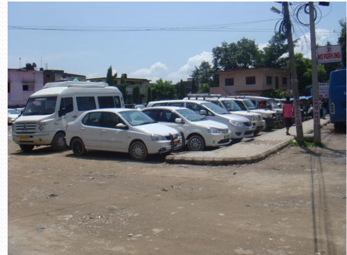
बेलहियाको सशुल्क पार्किङ्ग स्थल