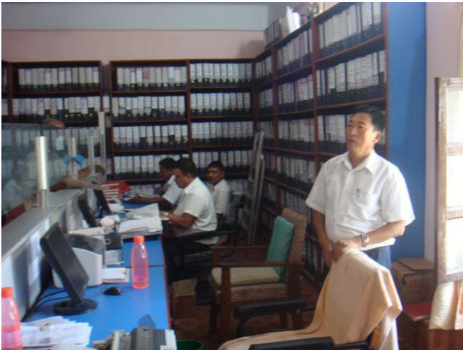
एकीकृत सम्पत्ती कर उपशाखा