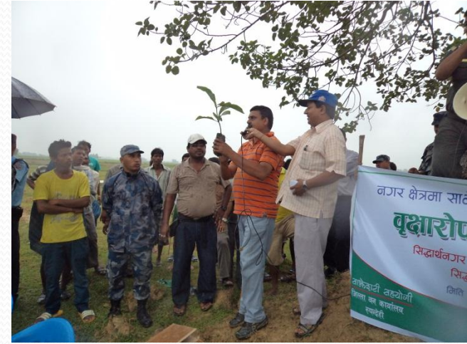
वडा नं. ११ को सिद्धार्थ वन बाटिकामा विभिन्न जातिका २४ सय विरुवाहरु रोपीएको ।