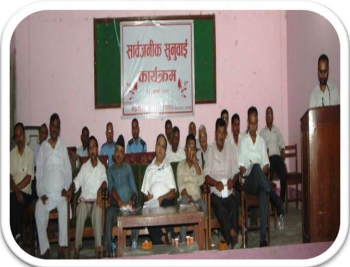
सार्वजनिक सार्वजनिक सुनुवाइका केही तस्विरहरु