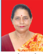
सरस्वती जवाली वडा सदस्य