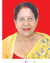
सरस्वती श्रेष्ठ वडा सदस्य