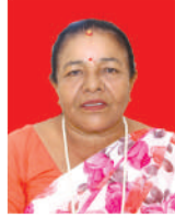
द्रुपदा पनेरु वडा सदस्य