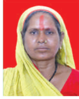
रम्भावती चाई वडा सदस्य