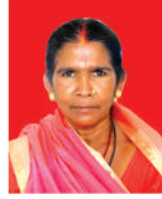
असर्फी हरीजन वडा सदस्य