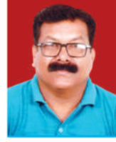
राजकुमार अहिर वडा सदस्य