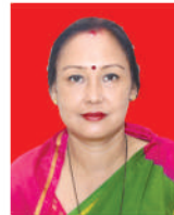
नीलु सिरीस मगर वडा सदस्य